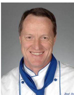
Josef Stalder Kantonsspital, Baden