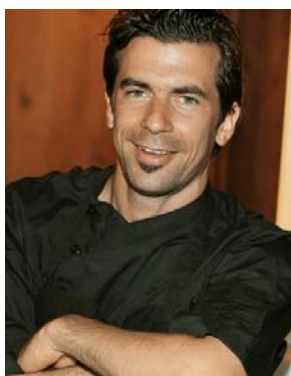
Andreas Caminada Restaurant Schauenstein, Fürstenu, Koch des Jahres 2008 und 2010 Cuisinier de l'année 2008 et 2010