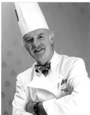
Anton Mosimann Ambassadeur de la Cuisine Suisse, London