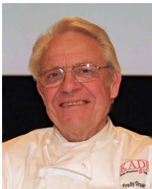
Frédy Girardet Cuisinier du siècle, Féchy