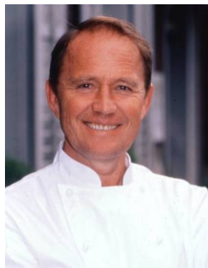
Horst Petermann Restaurant Kunststuben, Küsnacht